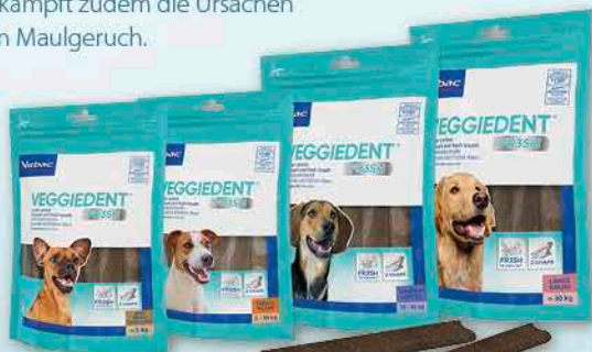
VeggieDent in 4 Größen XS, S, M, und L, für alle Hunderassen

VeggieDent® sind kalorienarme Kaustreifen für Hunde mit 100 % pflanzlichen Inhaltsstoffen. Sie enthalten kein tierisches Protein und keinen Weizen und sind somit gut geeignet für Hunde mit einer Nahrungsmittelintoleranz. Die Textur und die patentierte Z-Form sorgen für eine verstärkte mechanisch abrasive Reinigung der Zähne, wodurch die Plaque- und Zahnsteinbildung reduziert wird. Die innovative FRESH-Formel mit Granatapfel, Erythritol und Inulin bekämpft zudem die Ursachen von Maulgeruch.