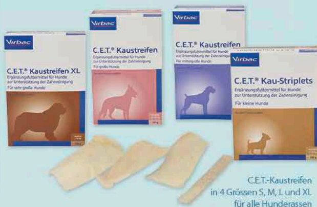
C.E.T.-Kautstreifen in 4 Grössen S, M, L und XL für alle Hunderassen

Eine Alternative zum Zähneputzen sowie eine sinnvolle Ergänzung sind die enzymhaltigen C.E.T.-Kautstreifen® . Hunde lieben es, auf Gegenständen herumzukauen. Dieser natürliche Kautrieb dient der Stärkung der Zähne und der Beissmuskulatur, fördert den Speichelfluss und reinigt die Zähne. Weil Hunde den Geschmack und die Textur der Rinderhaut-Kautstreifen lieben und diese lange kauen, entsteht eine wirksame zahnreinigende Schabwirkung. Zur Optimierung und Unterstützung dieser mechanischen Zahnreinigung sind die Kautstreifen mit C.E.T.-Enzymen beschichtet.