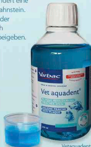
Vetaquident 250 und 500 ml

Vetaquident® enthält Xylitol. Dieser Zuckeraustauschstoff wird von plaquebildenden Bakterien absorbiert, kann aber nicht verwertet werden, und die Bakterien sterben ab. Angenehmer Nebeneffekt: Ohne die Bakterienvermehrung gibt es auch keinen schlechten Atem beim Haustier. Ausserdem bindet Xylitol im Speichel an Kalzium- und Phosphat-Ionen und verhindert eine Ablagerung in Form von Zahnstein. Vetaquident ist einfach in der Anwendung: Einmal täglich dem frischen Trinkwasser begeben.